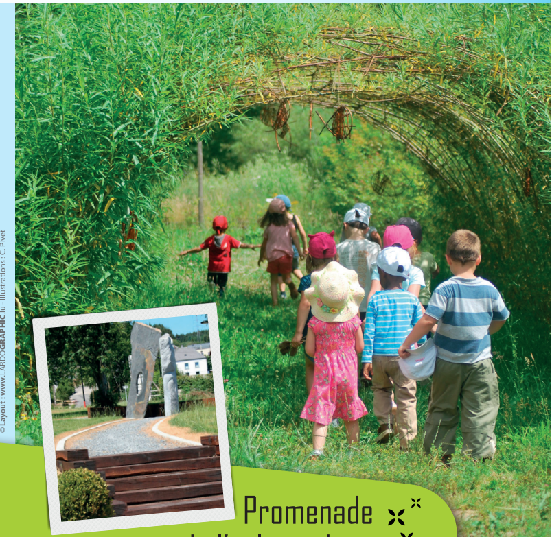
© Layout : www.LARDOGRAPHIC.lu - Illustrations : C. Pivet

Promenade de l'œil qui chante à Martelange